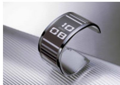
Aplicación del papel electrónico — Reloj Digital (Seiko Wcorp.)

En Europa, Ifra está discutiendo pruebas con 21 periódicos de 13 países. El New York Times es un miembro. Sony por su parte, está en discusiones con algunos publicistas para ofrecer descargas de periódicos desde sus bibliotecas electrónicas las cuales deben comenzar a operar dentro de poco.